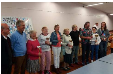
Le Club Scrabble (40 adhérents) Participation au Championnat